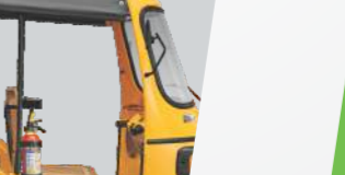
మెరుగైన హెడ్ రూమ్