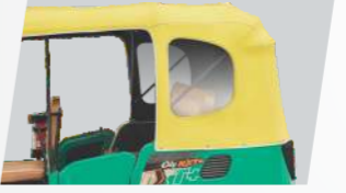
పెద్ద మరియు పారదర్శక విండోతో స్టైలిష్ హ్యాచ్