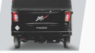
సమకాలీన రియర్ లుక్స్