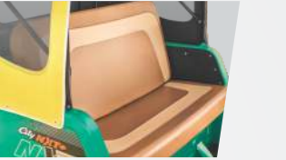
డ్యూయల్ టోన్ సీట్లు