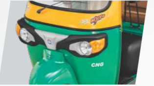
స్టైలిష్ ఫ్రంట్ ఫాసియా