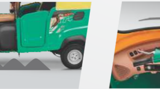
అత్యధిక గ్రౌండ్ క్లియరెన్స్