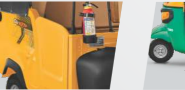
ప్రయాణికులకు సురక్షితమైన డోర్