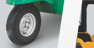
పరిశ్రమలోనే మొట్టమొదటి ట్యూబ్ లెస్ టైర్